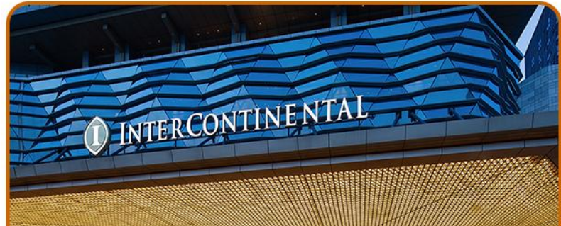
優選住宿 享受奢華住宿體驗 入住兩晚超豪華五星洲際酒店

早餐過後，前往成都古街【錦裏】，古街內青瓦鱗次櫛比，青石板路曲折蜿蜒。這裏的各類美食定會讓你饞涎欲滴，有張飛牛肉、豆花、牛肉焦餅、鉢鉢雞等，風味各異。參觀【武侯祠】，中國唯一一座君臣合祀的祠廟，是民眾對諸葛亮“鞠躬盡瘁，死而後已”精神予以肯定的載體，也是三國遺跡的源頭。前往都江堰遊覽【熊貓樂園】，營造了適合大熊貓及多種珍稀野生動物棲息繁衍的生態環境，在此能夠欣賞到憨態可掬的國寶